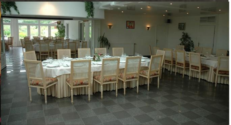
Salle bar 80 m2