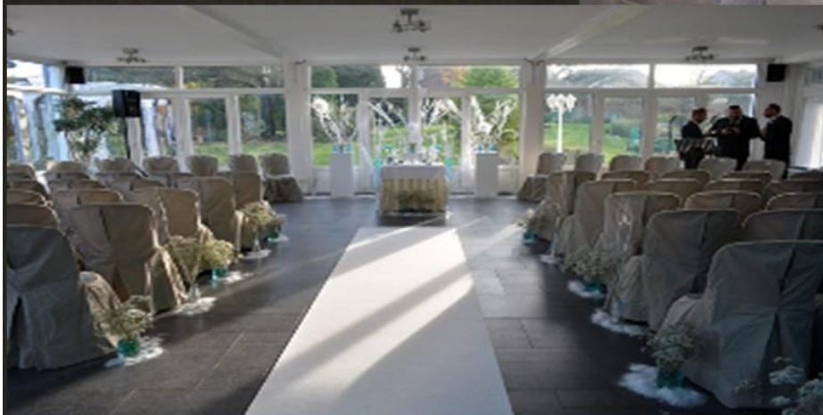
Nouvelle salle 140 m2