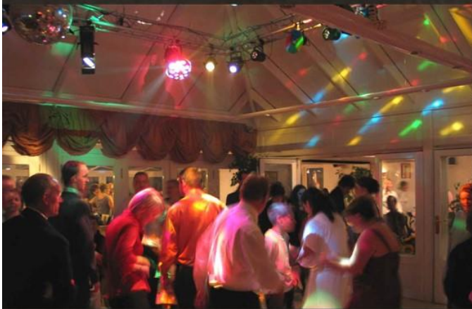
Piste de danse 40 m2