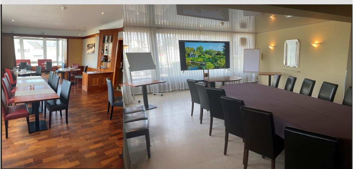
Salon 1 30 m 2