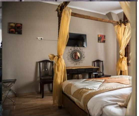
Hôtel sur place 8 chambres