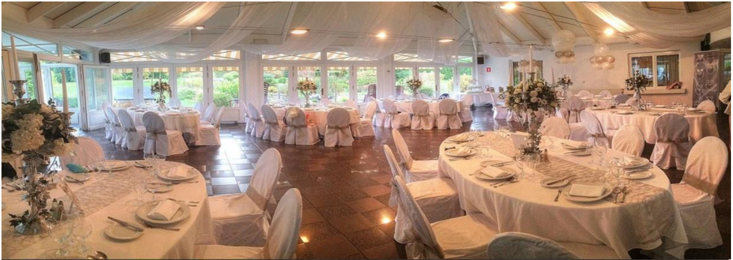
Grande Pyramide 120 m2